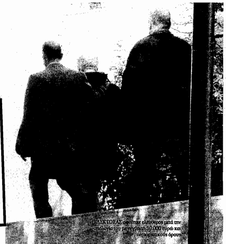
Ο ΛΕΚΤΟΡΑΣ αφέθηκε ελεύθερος μετά την απολογία του με εγγύηση 30.000 ευρώ και περιοριστικούς όρους

Τα... σύννεφα στη σχέση μεταξύ τους άρχισαν από τον Αύγουστο του 2005, όταν οι τέσσερις επενδυτές ζήτησαν το κεφάλαιό τους πίσω, προκειμένου να ανοίξουν δικό τους μαγαζί.